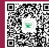
Fördermitgliedschaft für den BPhD e. V.

Mit einer Mitgliedschaft im Verein zur Förderung der Pharmaziestudierenden und des BPhD unterstützen Sie auch gezielt Anschaffungen der Fachschaften vor Ort, um möglichst optimale Studienbedingungen zu schaffen.