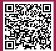
Fördermitgliedschaft für Noweda