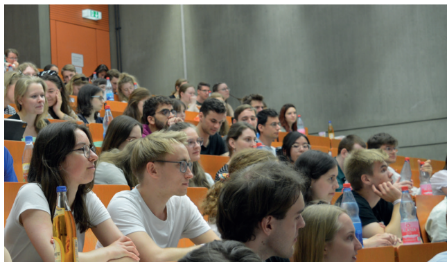
20. PharmaWeekend in Würzburg, 2023

Im Jahr veranstaltet der BPhD unter anderem zwei Bundesverbandstagungen (BVTs) und ein Fortbildungswochenende (PharmaWeekend).